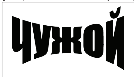
Схема II. Вторая стратегия вписывания себя в пространство эмиграции как способа защиты, которое вырастает из общего ощущения бездомности, которое дает свободу в выборе пространства вписывания и раздвигает его границы. Картина мира характеризуется интересом, неизвестностью, скукой/однообразием прошлой жизни, запутанностью, гибелью себя прошлого, разочарованием и отречением от прошлой жизни.

Схема I. Первая стратегия иллюстрирует неприятие новой средой, однако острая необходимость идентифицировать себя с группой объясняет создание многочисленных сообществ и братств как один из способов построения своего пространства. Картина мира эмигранта в данном случае состоит из следующих составляющих: желание вернуться, ностальгические настроения, страх, зависть, отчуждение